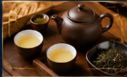
ชาอู๋หลงหอมกรุ่น ชาหอมเข้มข้น รสกลมกล่อม จากแหล่งปลูกคุณภาพ