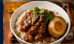
ข้าวหน้าหมูพะโล้ หมูนุ่มละมุน เคี้ยวจนหอมหวาน กลมกล่อม