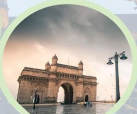
ประตูสู่อินเดีย (Gateway of India) อ่าวมุมไบ Arabian Sea