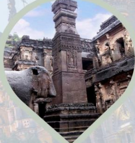
มัมมอรรณยูถ้ำไทรลาส ไฮไลท์ ถ้ำ เอลโลรา