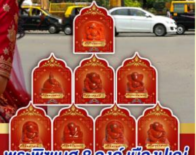
พระพิฆเนศ 8 องค์ เมืองปูณ