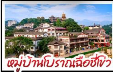
หมู่บ้านโบราณฉือซื่อโจว

พระแกะสลักหินตำจู้ - ตึกตะเกียบ Raffles City - ตึกยูยี่ซิง เกรตเตอร์เบียร์ - หมู่บ้านโบราณฉือซื่อโจว