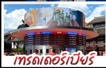
เกรตเตอร์เบียร์