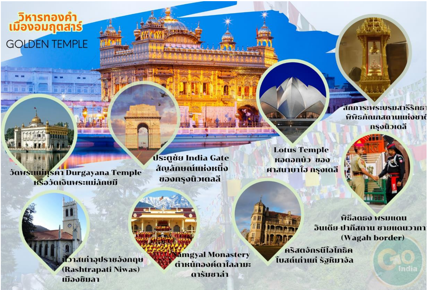
วัดพระแม่สุคา Durgayana Temple หรือวัดเงินพระแม่ลักษมี